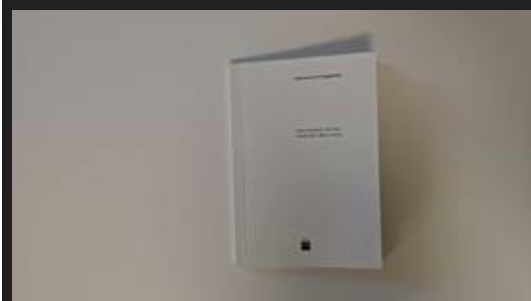
Trajectories of engagement.